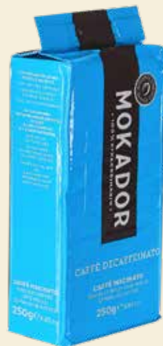
CAFFÈ MACINATO DECAFFEINATO